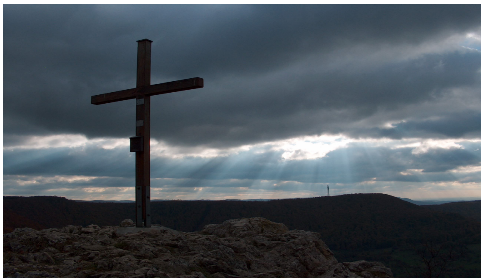
auf dem Roßfels ( 775 m )