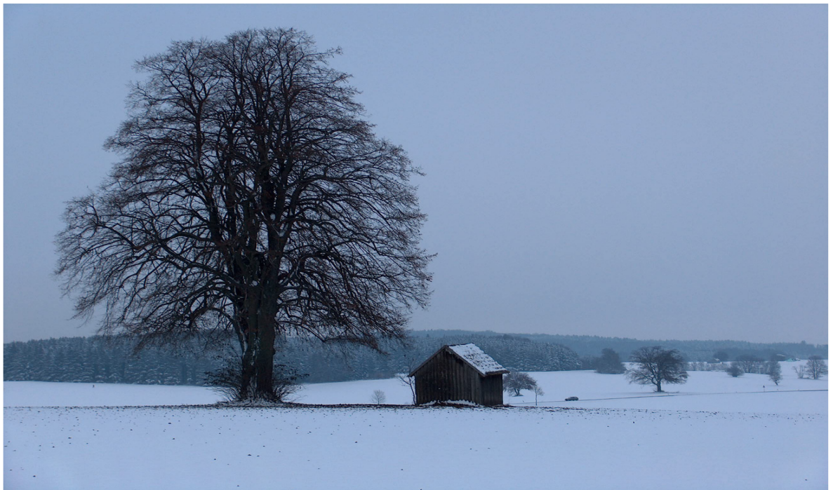
November 2007 - Althochfläche