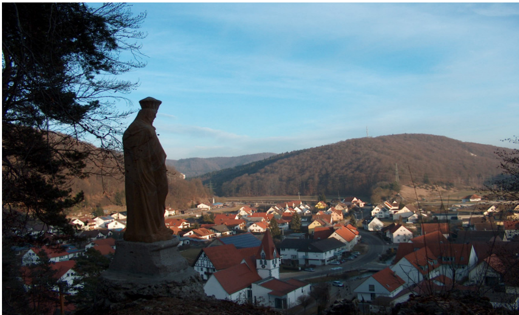
über der Ortschaft Schmiechen ( Alb-Donau-Kreis )