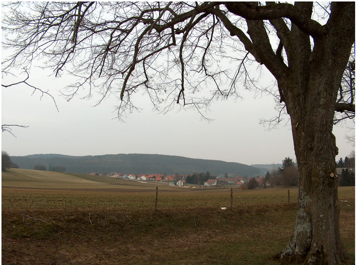
Böhringen von oben ( von der Nordseite aus gesehen )