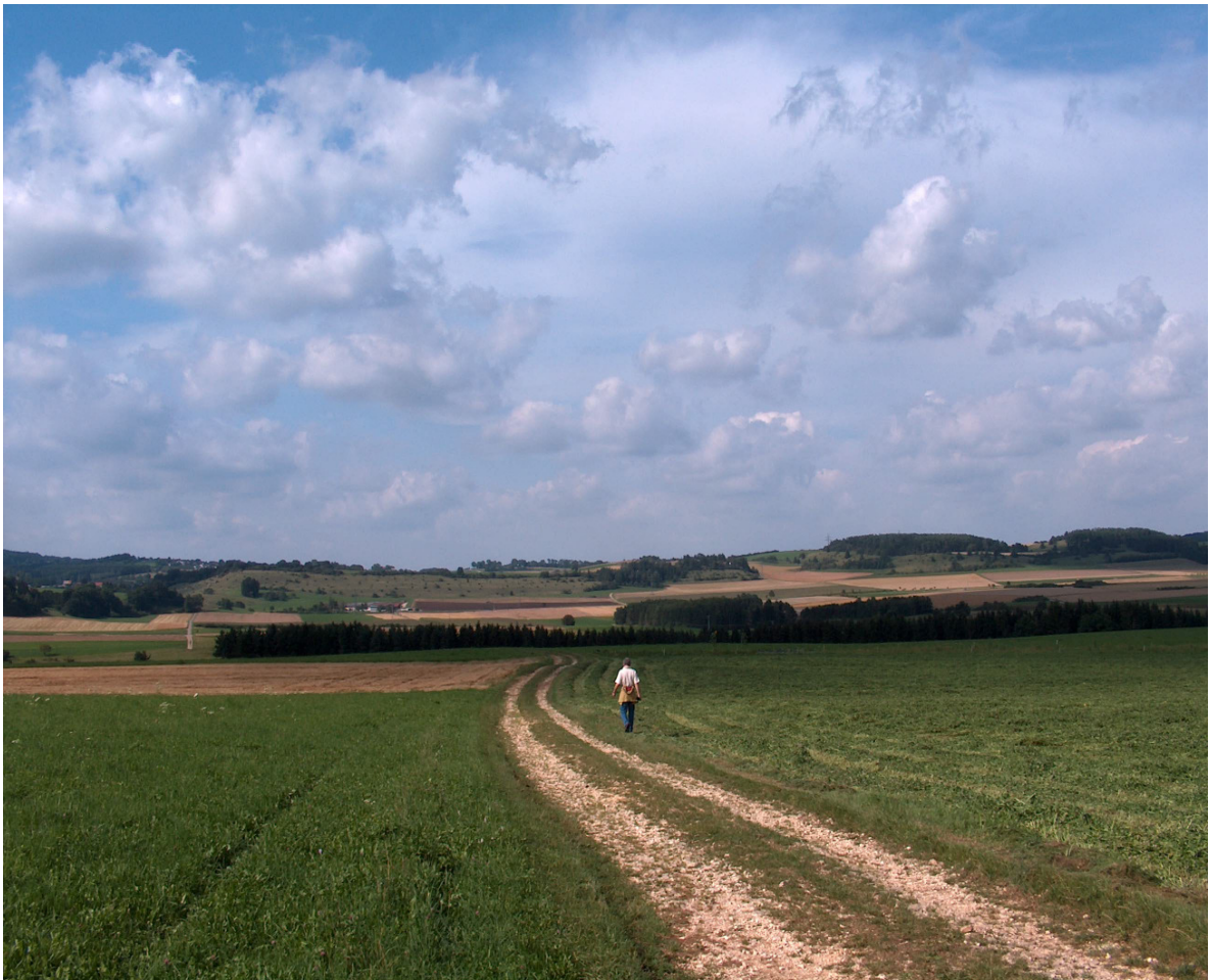
bei Münsingen zwischen Fauserhöhe und Schalkenberg